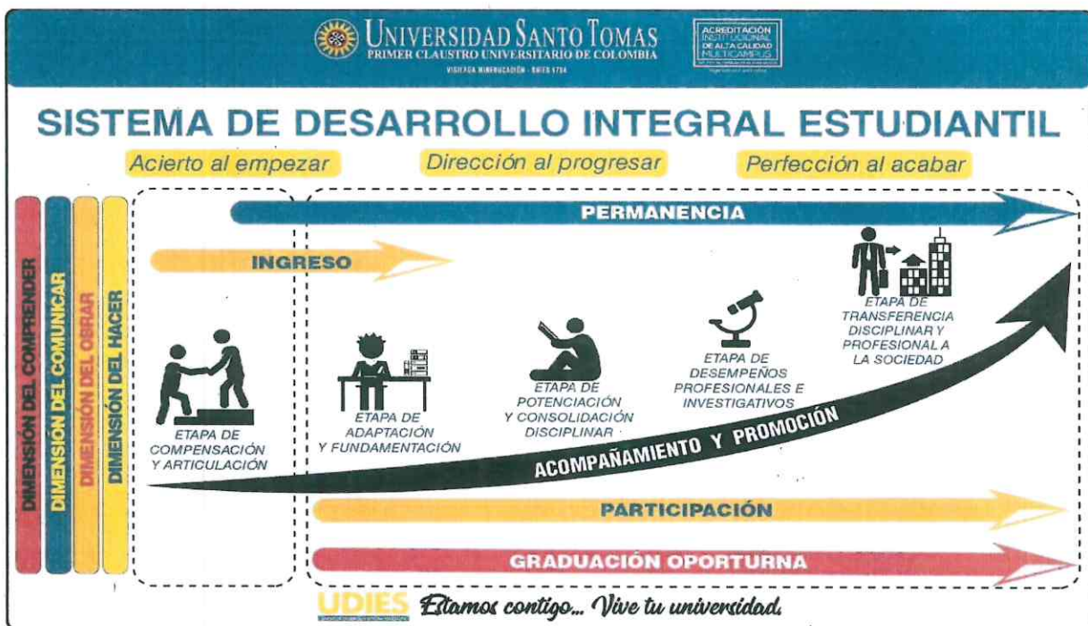
Figura 3: Estructura del Sistema de Desarrollo Integral Estudiantil.

Desde estas claridades, el Sistema de Desarrollo Integral del Estudiante, toma a consideración cada una de las Fases que hacen parte del crecimiento tanto académico como personal del estudiante tomasino en su transitar por la institución. Inspirados en la oración de santo Tomás de Aquino para antes del estudio, que se enmarcan en la articulación del proceso de ingreso con “acierto al empezar”, la permanencia y participación con la “dirección al progresar”, y el proceso de graduación oportuna con “perfección al acabar”. A la vez, se retoma la concepción de estudiante para la USTA, como “socio por excelencia de la misión institucional”, es por ello que la participación se enmarca como uno de los cuatro elementos fundamentales del sistema de desarrollo integral estudiantil. Frente a ello, en el siguiente gráfico, se presenta la estructura del Sistema de Desarrollo Integral Estudiantil.