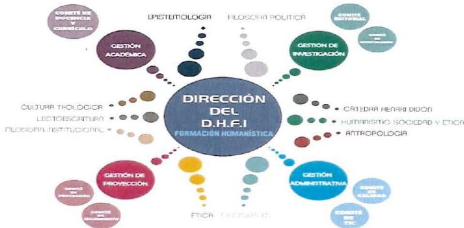
Organigrama del Departamento de Humanidades y Formación Integral